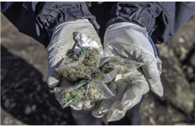
Drogenfunde und Handel belasten den Görlitzer Park

Der Görlitzer Park soll umzäunt und nachts geschlossen werden. Das hat sich schon am Tempelhofer Feld und in vielen anderen großen Parks anderer Städte bewährt. Die