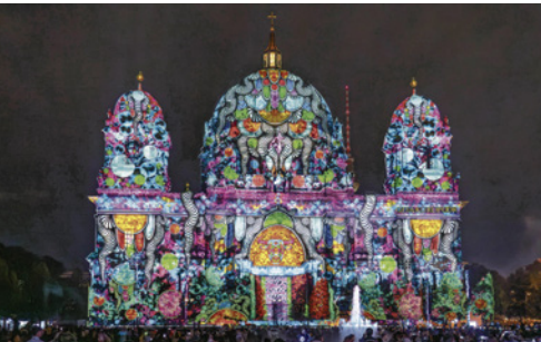
Der angestrahlte Berliner Dom beim „Festivals Of Lights“