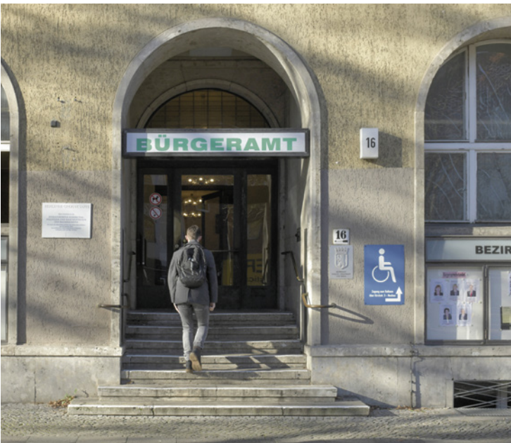
Mehr Digitalisierung entlastet Berlins Bürgerämter

Und was bedeutet das nun konkret? Die Bürgerdienstleistungen sollen digital angeboten werden. Das spart Zeit und Nerven. Und dann haben die Mitarbeiter in den Behörden auch Zeit, sich um die Anliegen der Menschen zu kümmern, die nicht mit Smartphone und Co. aufgewachsen sind. Gleichzeitig heißt Verwaltungsreform auch: effizientere und schnellere Verwaltung. Und das bedeutet schlussendlich: mehr Service und weniger Bürokratie.