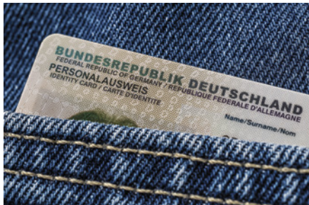
Ausweis erneuert, Problem gelöst

Auf massiven Druck der CDU-Fraktion haben die Verursacher schließlich die Reinigungskosten von mehr als 14.000 Euro beglichen.