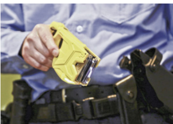
Berlins Polizisten werden jetzt mit Tasern ausgestattet

Wenn eine Straftat oder eine Ordnungswidrigkeit von erheblicher Bedeutung zu erwarten ist, konnte die Person bisher für maximal zwei Tage in Gewahrsam genommen werden. Dieser Zeitraum kann nun deutlich ausgeweitet werden, auf bis zu fünf Tage, bei Androhung einer terroristischen Tat sogar bis zu sieben Tage.