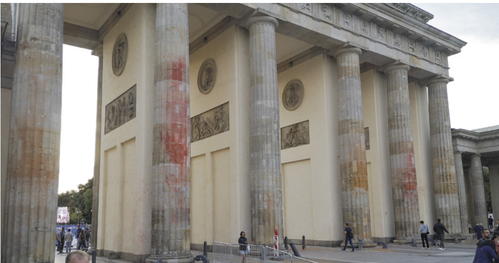
Das Brandenburger Tor, vom Farbanschlag der Klima-Schmierer gezeichnet

Es ist das Symbol von Freiheit und Demokratie, das vielleicht bekannteste Wahrzeichen Berlins. Im September wurde es von Klebeschmutz mit Farbe beschmiert. Das könnte jetzt teuer werden für die Täter: Sie sollen für die Schadenbeseitigung bezahlen. Die Kosten dafür steigen immer weiter. Denn erst jetzt kam heraus, dass die Farbe leider viel tiefer als erwartet in den Sandstein eingedrungen ist. Von einem sechsstelligen Betrag ist jetzt die Rede. Deshalb unterstützt die CDU-Fraktion nachdrücklich den Vorschlag des Regierenden