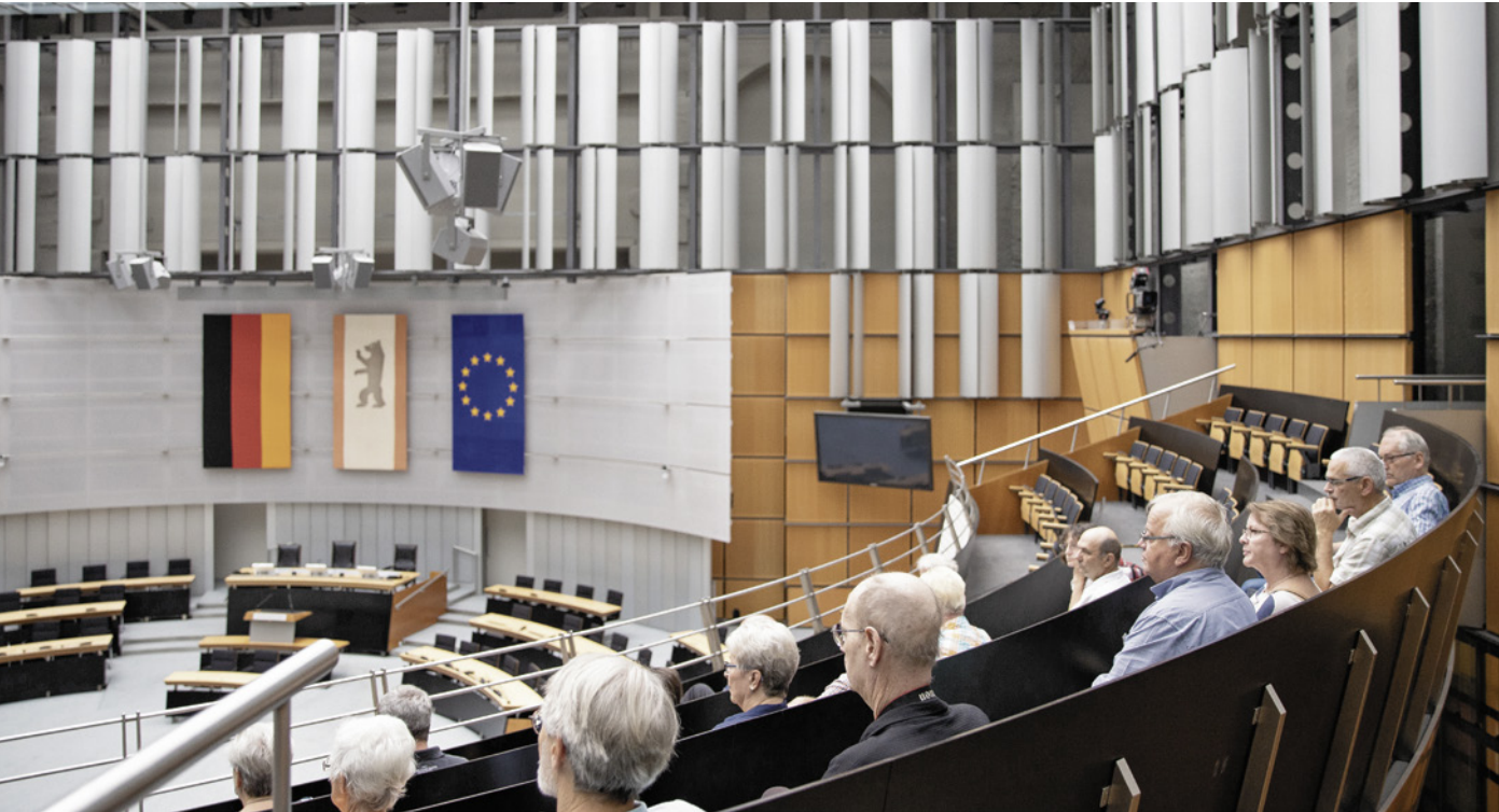
Für Sie geöffnet: Besuchertribüne des Plenarsaals