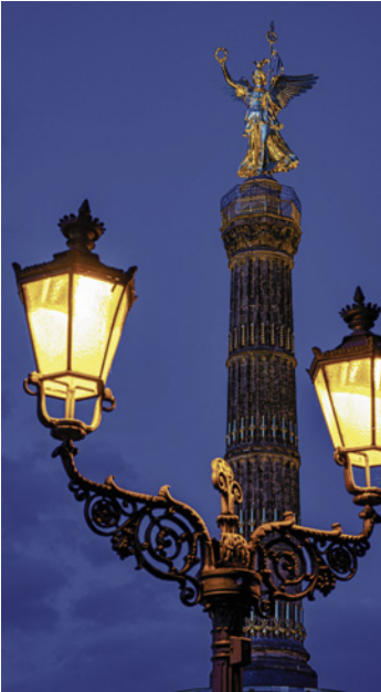
Gasleuchten werden auf Elektrobetrieb umgestellt

In Berlin sollen die bisherigen 24.000 Gasleuchten auf Elektrobetrieb umgerüstet werden. Gut fürs Klima, denn dadurch werden im Jahr je Leuchte rund eine Tonne Kohlendioxid weniger ausgestoßen.