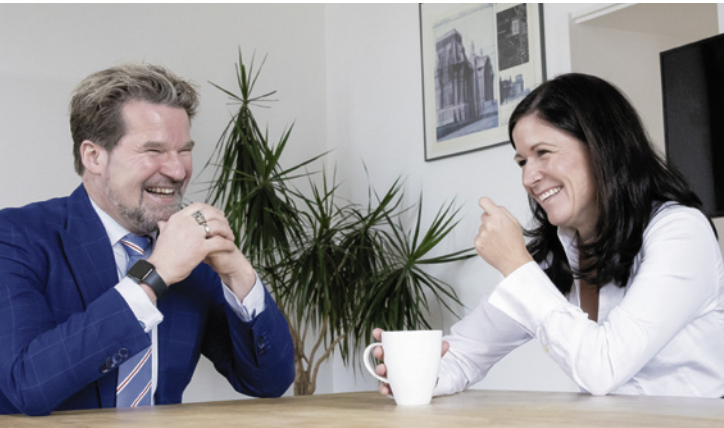
Ausgelassene Stimmung bei den persönlichen Fragen: „Mein Drittklässler hat mir eine Wunschliste gegeben, was ich verbessern soll!“