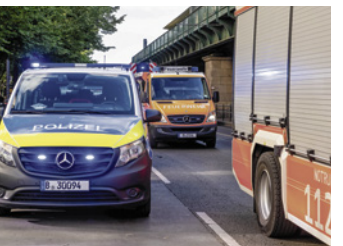
Wir entlasten die, die uns schützen

Wer in Schicht zum Wohl der Berliner arbeitet, soll von Parkgebühren entlastet werden. Diese langjährige Forderung der CDU-Fraktion setzt jetzt der Senat für Polizisten, Feuerwehrleute und Justizbeamte um. Zuständig für Ausnahmeerteilungen sind nicht mehr die Bezirke, sondern das Landesamt für Bürger- und Ordnungsdienste.