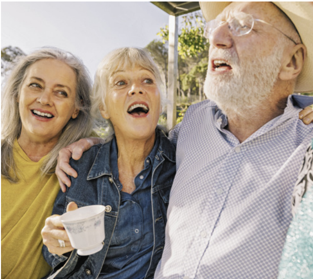
Lebenserfahrene Berlinerinnen und Berliner stehen im Focus der CDU-geführten Koalition

mit Seniorengruppen ein Altenhilfestrukturegesetz in der Planung. Dabei geht es darum, im Rahmen der Altenhilfe die selbstbestimmte Teilhabe am Leben der Gemeinschaft sicherzustellen. Hierbei ist es unerlässlich, die aktuelle Lebenssituation lebenserfahrener Berlinerinnen und Berliner zu ergründen, um die Lebensqualität schrittweise zu verbessern. Eine Studie hierzu wird jetzt beauftragt.