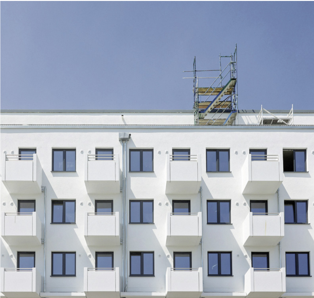
Gegen die Wohnungsnot hilft nur mehr Wohnraum

Einmal im Jahr ist Berlin Schauplatz des weltweit vielleicht schönsten „Festivals Of Lights“. Die bekanntesten Bauwerke wie der Gendar-