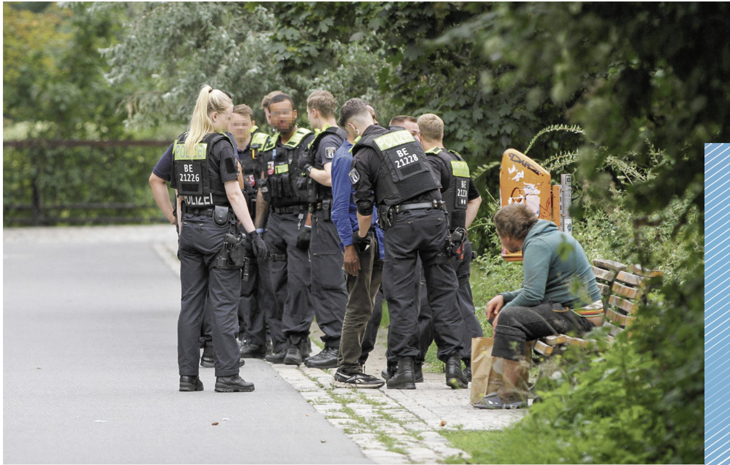
Der Görlitzer Park: Unter Grünen-Verantwortung im Bezirk ist er zu einem Kriminalitätsschwerpunkt und Drogenumschlagplatz geworden