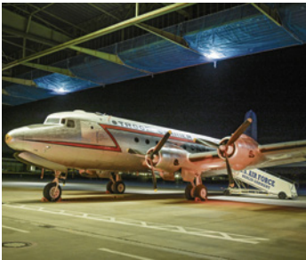
100 Jahre Flughafen Tempelhof

Der Flughafen Tempelhof besteht jetzt 100 Jahre. Wo erstmals am 8. Oktober 1923 Flugzeuge abhoben, haben in der Berlin-Blockade durch die Sowjets „Rosinenbomber“ der West-Alliierten die Berliner über die legendäre Luftbrücke versorgt und das Überleben gesichert. Heute ist das Flugfeld beliebter Freizeitreff. An die wechselvolle Geschichte wurde im Rahmen der Reihe „100 Stunden nonstop Jubiläumsprogramm“ erinnert.