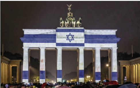
Das Brandenburger Tor in den Farben der israelischen Flagge

Damit setzt die CDU-geführte Koalition eines ihrer zentralen Vorhaben um und stellt die Weichen, um die vorgenommenen Neubauziele auch tatsächlich zu erreichen.