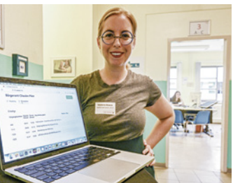
Mehr Bürgerämter sollen Entlastung beim Termin- druck bringen

2024 sollen zwei neue Bürgerämter in Spandau und Marzahn-Hellersdorf eröffnen, 2025 kommen zwei weitere in Treptow-Köpenick sowie Pankow dazu. Hierfür sind 100 neue Stellen geplant, ein zusätzlicher „Belastungspool“ von 20 Springern soll Spitzenbelastungen abfedern.