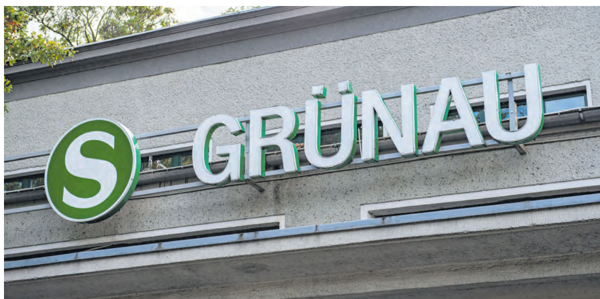
S-Grünau: Ein wichtiger Knotenpunkt im Südosten Berlins

Das Thema Sicherheit an Bahnhöfen, insbesondere in der kommenden dunklen Jahreszeit, ist für ganz Berlin ein großes Thema. Auch hier in Grünau wurden an die Abgeordnete zahlreiche Beschwerden über Belästigungen und ein erhöhtes Müllaufkommen im S-Bahnhof Grünau herangetragen. Daraufhin gab es ein Gespräch mit der DB-Sicherheit um eine Lösung zu finden. Im ersten Schritt wurde nun eine vermehrte Präsenz am Bahnhof von Montag bis Freitag in den Zeiten von 7:00-9:00 Uhr und von 16:00-18:00 Uhr vereinbart. Das soll dafür sorgen, dass sich die Menschen auf ihrem Weg zur Arbeit sicherer fühlen. Selbstverständlich löst sich dadurch das Problem nicht dauerhaft. Hier müssen soziale Unterstützungsangebote für