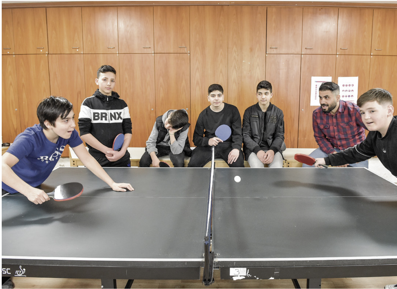
Beim Tischtennis stellen junge Berliner in Jugendclubs Können und Schnelligkeit unter Beweis

Leopoldplatz: Allein 2022 wurden 22.000 Spritzen eingesammelt. Die Zahl der schweren Diebstähle ist gegenüber dem Vorjahr von 198 auf 361 gestiegen. Die Delikte mit schwerer Körperverletzung im öffentlichen Raum haben sich in der gleichen Zeit auf 79 mehr als verdoppelt (2021: 40 Fälle), bis August 2023 waren es bereits 50.