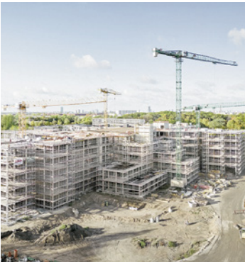
Mehr Geld und Tempo beim Bau neuer Schulplätze

Für den Schulbau werden die Gelder auf 5,6 Milliarden Euro in den nächsten zwei Jahren verdoppelt. Damit sollen Sanierung, Neubau und somit die Schaffung neuer Schulplätze vorangetrieben werden. Geplant sind in dieser Legislatur 25 neue Schulen, weitere werden saniert.