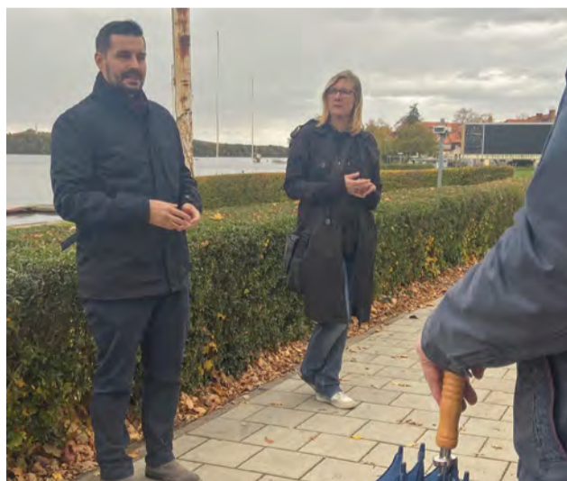
An der Regattastrecke Grünau

Am zweiten Oktober konnte ich zusammen mit dem Bezirksstadtrat für Weiterbildung, Schule, Kultur und Sport, Marco Brauchmann, zum ersten Kiezspaziergang durch das Gelände des Wassersportzentrums in Grünau einladen. Trotz schlechten Wetterbedingungen haben sich einige wetterfeste Grünauer dem Kiezspaziergang angeschlossen. Vor Ort konnten wir die geplanten und notwendigen Maßnahmen unmittelbar an der Regattastrecke und der dazugehörigen Sportinfrastruktur zeigen und erklären,