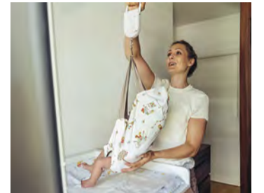
Hebamme wiegt ein Baby

Die Kurse für künftige Hebammen an der Charité sind finanziell gesichert. Die CDU-geführte Koalition verständigte sich darauf, dafür drei Millionen Euro in den beiden kommenden Jahren bereitzustellen.