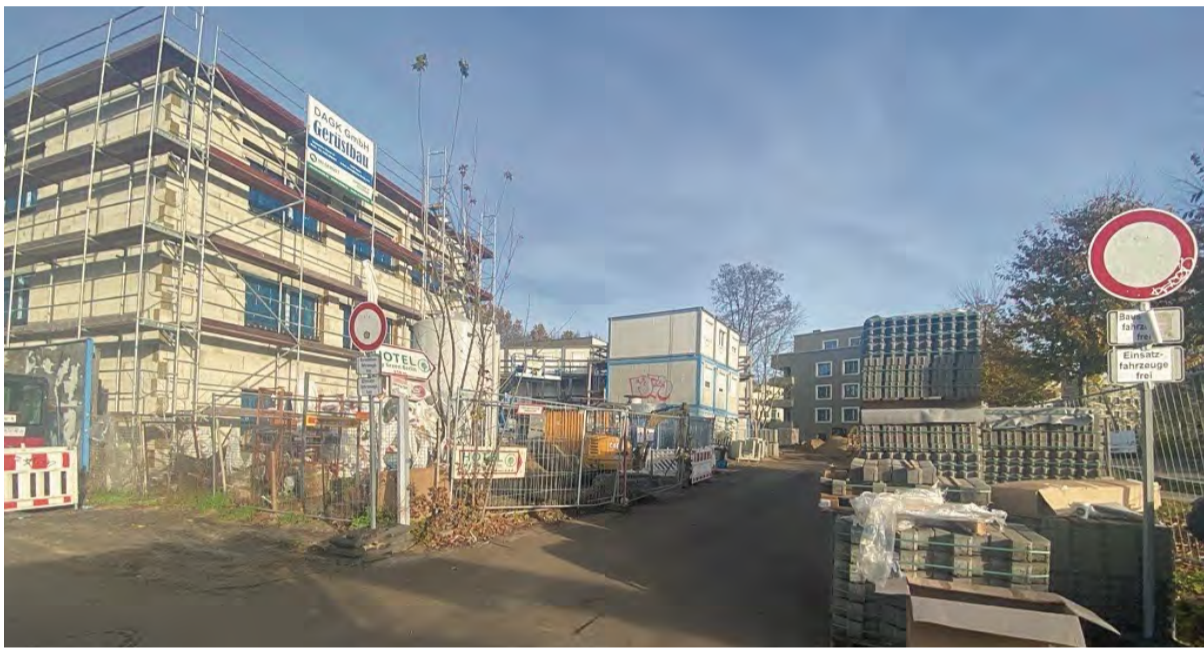
Wachsender Bezirk Treptow-Köpenick

Die im November 2025 veröffentlichte Prognose der Senatsverwaltung zeigt, dass die Berliner Bevölkerung bis zum Jahr 2040 auf über 4 Millionen Einwohner anwachsen wird. Innerhalb dieses gesamtstädtischen Trends nimmt der Bezirk Treptow-Köpenick eine Vorreiterrolle ein: Mit einem prognostizierten Zuwachs von rund 9 bis 10 Prozent bis 2040 (etwa 28.000 zusätzliche Einwohner) hat Treptow-Köpenick den höchsten prozentualen Anstieg aller Berliner Bezirke zu verzeichnen. Um diesem dynamischen Wachstum proaktiv und erfolgreich zu begegnen, wächst zeitgleich der Wohnungsbestand bereits mittelfristig stark an.