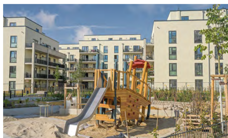
Wohnungsneubau wie hier in Haselhorst (Spandau) und Mieterberatung haben Priorität

Berlins Mietpreisprüfer sehen ganz genau hin und entdeckten in vielen Fällen sogar Überschreitungen von mehr als 50 Prozent der Vergleichsmiete – Verdacht auf Mietwucher,