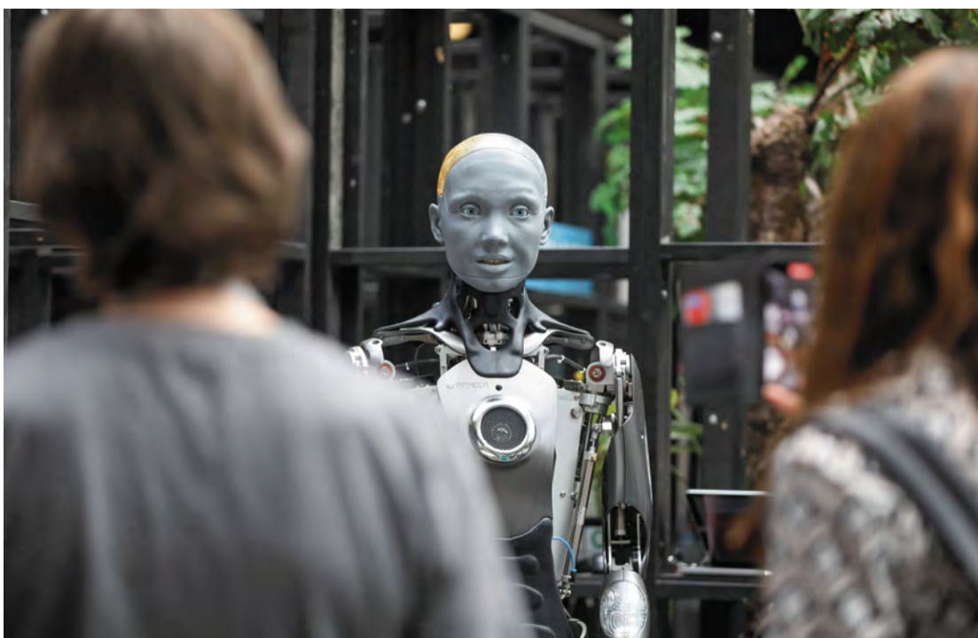
Digitale Neuheiten beleben Berlins Wirtschaft

Eine Sonderkonjunktur und bundesweiten Aufschwung erwarten Experten durch das milliarden schwere Sondervermögen der CDU-geführten Bundesregierung. Berlin kann hier mit rund 5,25 Milliarden Euro zusätzlich rechnen für Instandsetzung und Ausbau von Bauwerken bis hin zum Nahverkehr. Wie die CDU geführte Koalition in Berlin die Gelder verwenden wird? Antworten dazu finden Sie auf Seite 2.